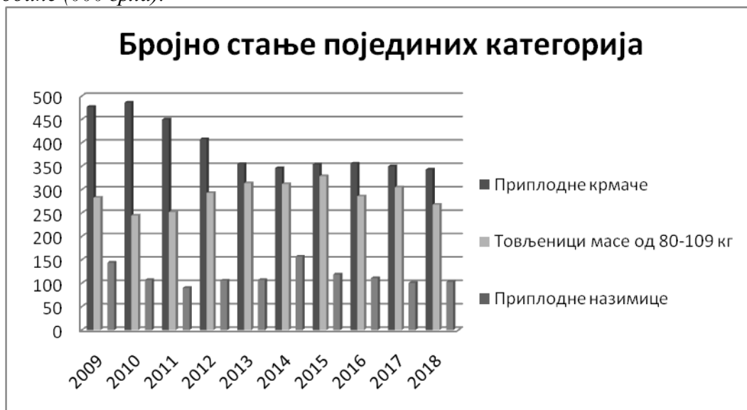
Графикон 1: Бројно стање појединих категорија свиња у Републици Србији од 2009. до 2018. године (000 грла).