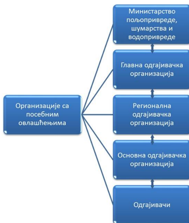
Схема 1. Организацијска структура субјеката

Однос појединих субјеката у извођењу Програма приказан је шематски: