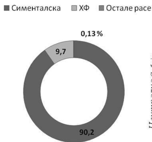
Графикон 2. Однос раса у матичној популацији